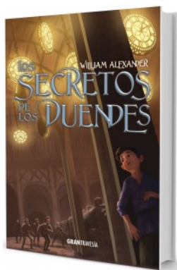
Los secretos de los duendes – William Alexander – Colección Gran Travesía (Océano)

Ser el único chico negro en un barrio inglés donde sólo hay gente blanca es apenas uno de los muchos problemas de Strato Nyman. También están las dificultades familiares y el bravucón de su escuela, Lloyd Archibal Turnbull, quien lo ha convertido en el objeto de sus burlas. Pero Strato posee una característica que lo convierte en un ser especial: es un genio de la física. Poco antes de cumplir trece años, descubre un enigmático volumen que supuestamente le enseña al lector cómo volverse invisible.