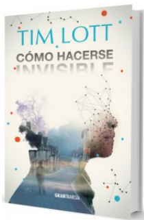
Cómo hacerse invisible – Tim Lott – Colección Gran Travesía (Océano)

Ser el único chico negro en un barrio inglés donde sólo hay gente blanca es apenas uno de los muchos problemas de Strato Nyman. También están las dificultades familiares y el bravucón de su escuela, Lloyd Archibal Turnbull, quien lo ha convertido en el objeto de sus burlas. Pero Strato posee una característica que lo convierte en un ser especial: es un genio de la física. Poco antes de cumplir trece años, descubre un enigmático volumen que supuestamente le enseña al lector cómo volverse invisible.